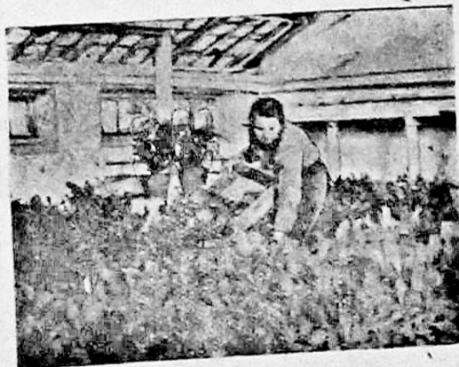
На снимке: сбор салата в теплицах масложиркомбината.

та, лука, свеклы. Произрастает рассада помидоров, огурцов. Свежие овощи, выращенные в теплицах комбината, поступают в рабочие столовые и детские сады.